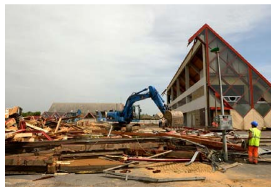
Dans cette partie sera notamment créé l'espace VIP.